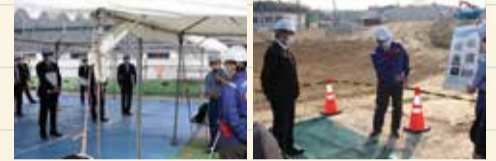
京奈和自動車道(大和北道路) 清滝生駒道路(高山大橋付近)