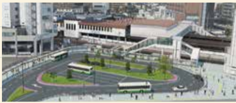
南北自由通路及び南口駅前広場(完成図)

令和3年4月1日、大和西大寺駅南口駅前広場供用開始。南北自由通路も完成しました。令和5年3月には北口駅前広場の整備も完了の予定です。