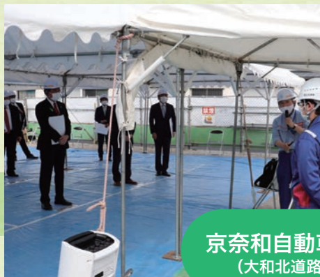
京奈和自動車道 (大和北道路)