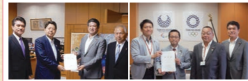
林芳正文部科学大臣(写真左)、 丹羽秀樹文部科学副大臣(右)へ要望 ※役職は当時