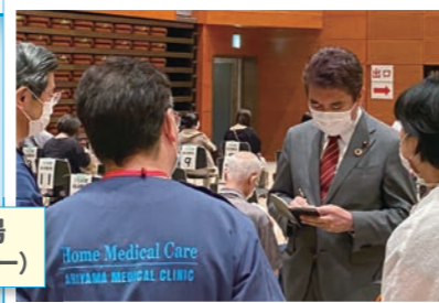
生駒市ワクチン接種会場 (生駒市北コミュニティセンター)