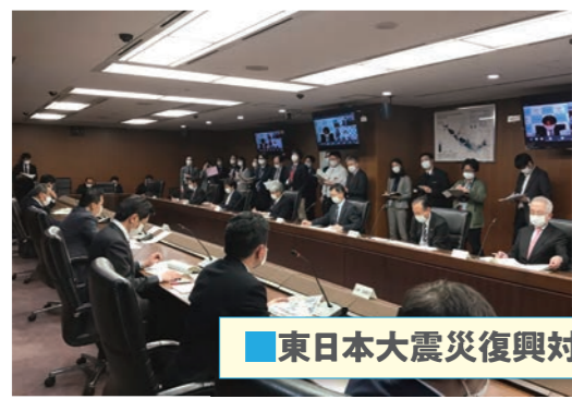
東日本大震災復興対策本部