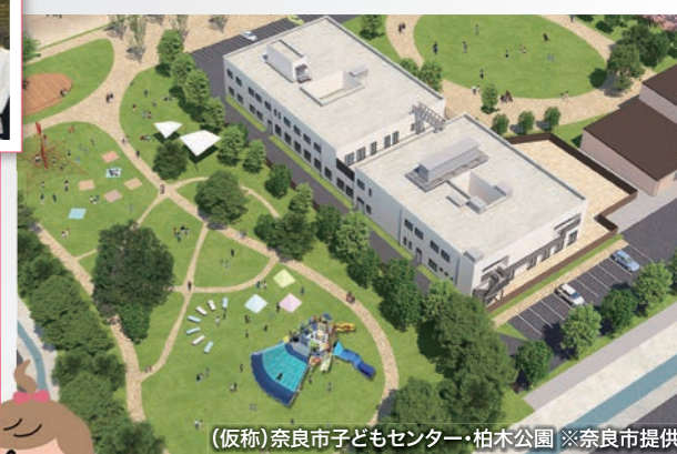
(仮称)奈良市子どもセンター・柏木公園