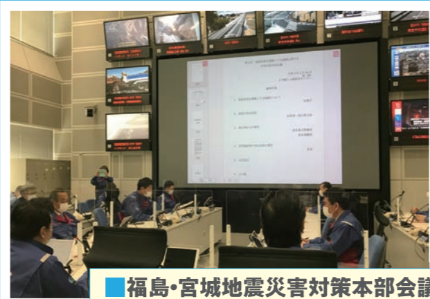
福島・宮城地震災害対策本部会議 (令和3年2月13日・発生直後)