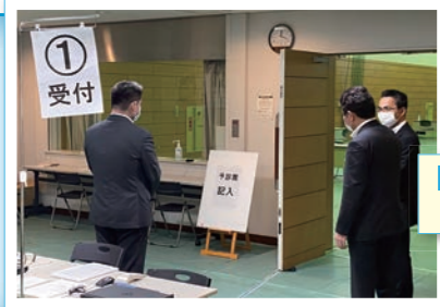
奈良市ワクチン接種会場 (奈良市西部公民館)