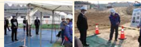
京奈和自動車道(大和北道路) 清滝生駒道路(高山大橋付近)