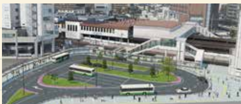
南北自由通路及び南口駅前広場(完成図)

令和3年4月1日、大和西大寺駅南口駅前広場供用開始。南北自由通路も完成しました。令和5年3月には北口駅前広場の整備も完了の予定です。