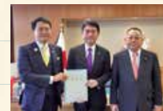
小紫生駒市長、中谷市議会議長から「清滝生駒道路(国道163号)」早期完成への要望を受ける