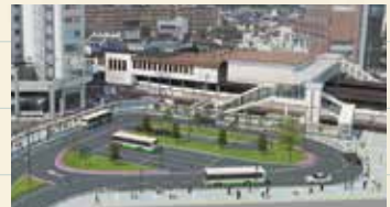
南北自由通路及び 南口駅前広場(完成図)

30年越しで実現! 南北自由通路も完成 2023年3月には北口駅前広場の 整備も完了の予定