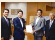
仲川奈良市長と林芳正 文部科学大臣(当時)に要望