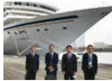
横浜港、福島県復興、 福井県日野川、京都府天ヶ瀬ダム ほか現地調査