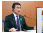
2021.5.4 G20観光大臣会合(テレビ会合)

国政 2020.9.18 国土交通大臣政務官就任 (航空局 港湾局 都市局等担当)