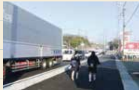
安全確保、渋滞解消へ 整備が進む