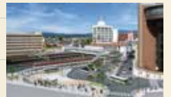
南北自由通路及び北口 駅前広場(完成予想図)