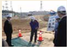
高山大橋付近を 現地調査