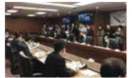
2021.3.9 東日本大震災復興 対策本部会議