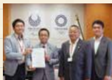
小紫生駒市長と丹羽秀樹 文部科学副大臣(当時)に要望