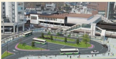
南北自由通路及び南口駅前広場 (完成図)

令和3年4月1日、大和西大寺駅南口駅前広場供用開始。南北自由通路も完成しました。令和5年3月には北口駅前広場の整備も完了の予定です。